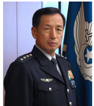
田母神 俊雄 氏

先の大戦とは、何だったのか？ 対中戦争について言えば、1937年7月北京市郊外の盧溝橋で、中国共産党学生部長劉少奇が率いた共産党ゲリラが、国民党軍を偽装して駐留日本軍へ仕掛けた発砲事件に端を発した日本軍 vs 国民党軍の軍事衝突は、その裏に実は、モスクワに本拠を置く国際共産主義(コミンテルン)の仕掛けた日中衝突の謀略であった。このことは、中国共産党が正史で認めている歴史であって、毛沢東も周恩来も劉少奇自身が認めている。だから、日本軍が対中国侵略を意図して十分なる準備を積み重ねた上で起こした「侵略戦争」などでは決して無かったのである。このことは、当時の日本陸軍は、北からの脅威の対ソ連国境防衛に対処するのが日本陸軍の伝統であったことから、中国侵略など考えていなかったことは明らかであった。だから、戦後に流布されたような歴史観、すなわち十分準備を積み重ね積極的に中国領土内に侵略して行こうとした意思などというのは全く無く、これは明白なる歴史の捏造である。また、対米戦争について言えば、1941年12月8日未明の日本海軍の真珠湾攻撃についても、米国内の怨戦気分払拭の為に日米軍事衝突を望んでいたのはルーズベルト米大統領やチャーチル英国首相であって、対独戦で欧州戦線に米国の参戦を望んでいた米英側は、日本軍を誘導して先制攻撃を米本土以外の外国米軍基地を攻撃させることによって、伏見宮海軍軍令部長らの対米強行派や山本連合艦隊司令官の唱える真珠湾攻撃を起こさようと仕組んでいた。そうした国際共産主義(コミンテルン)の仕掛けた謀略に、むざむざ日本軍は、対米戦への誘導に嵌められたのであります。つまり、国際共産主義の仕掛けに、帝国陸軍は望んでもいなかった「対中戦争」に嵌められ、帝国海軍は望んでもいなかった「対米戦争」に嵌められたのは歴史的な事実であります。だから、歴史の真実に熟知していれば、「日本侵略国家論」のような虚構の歴史捏造に洗脳されたりはしないものなのですが、戦後の占領体制と歴史への無知が生み出したのが、捏造された歴史観/日本侵略国家論であり、その定説化であります。その結果、今回のような田母神論文への拒否反応に見られるような「歴史の真実追究姿勢の欠如」が露わになるのであります。このように安全保障にとって最重要のテーマについて、当事者であられる田母神氏から直接にお話を戴きます。皆様には、大変ご多忙かと存じますが、お誘い合わせの上で多数の方々のご参加をお願い申し上げます。